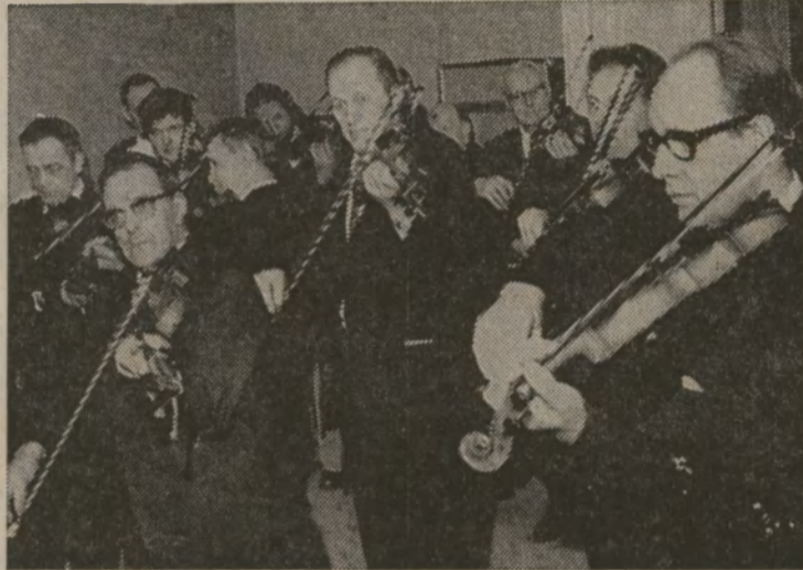
Det var ett verkligt stort inslag av stråkar då Södermanlands spelmän träffades för att hålla stämman i Gnesta på lördagen.

STUTUNA RK-KRETS har årsmöte i Bydegården nästa måndag. Man kommer det att visas film om g 71.