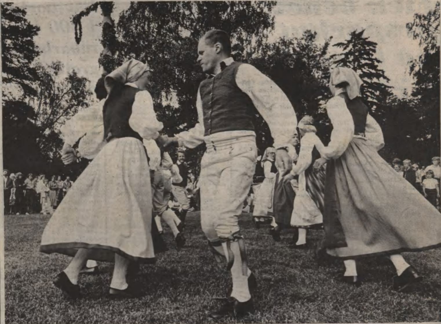
I Vackerby hage i Gnesta var det Järna folkdanslag som svarade för dansuppvisningen.