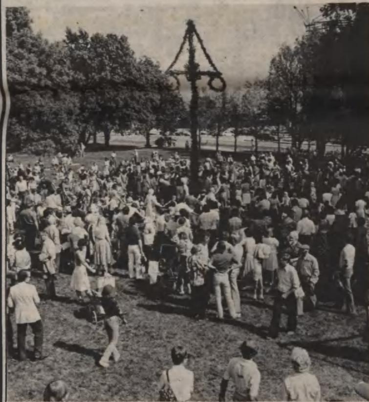
Mycket folk firade midsommaren vid Nyköpingshus där Nyköpingshus folkdanslag såg till att det dansades ordentligt.