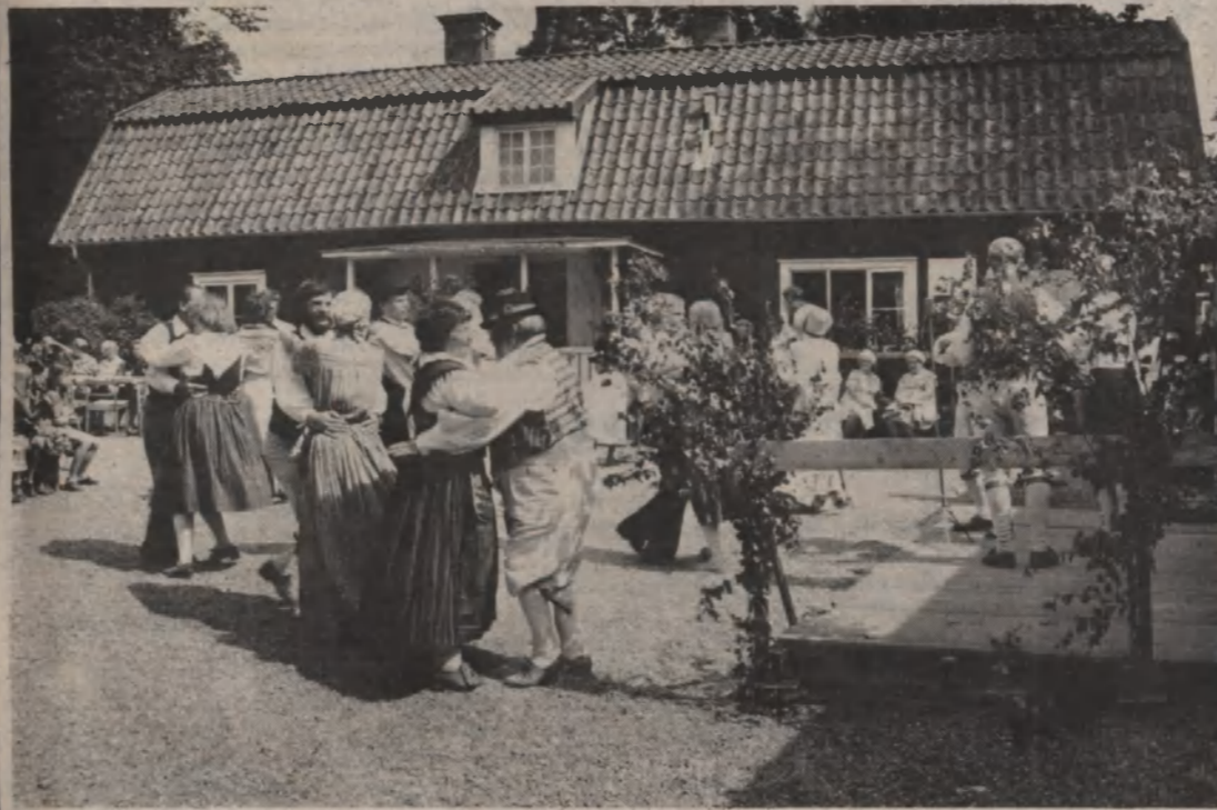
Gubbstöt, en gammal dans, körs här så dammet yr på Hembygdsföreningens gård i Malmköping.

Spelmansstämma hölls traditionsenligt i Malmköping på söndagen. Vid Hembygdsgården dansade man i gruset så dammet yrde. På förmiddagen var det en för-