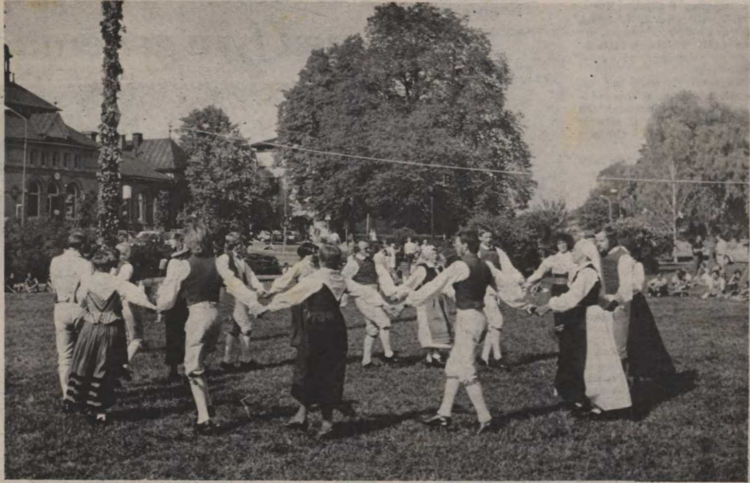
Dansen den går på grönan äng... Flens folkdanslag under en av sina många uppvisningar midsommarafton, nämligen den i Sveaparken i Flen.