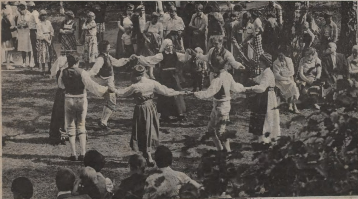
Ett mycket vackert midsommarfirande var det vid Hembygdsgården i Tunaberg där ett folkdanslag från Nyköpingshus svarade för dansuppvisningen.