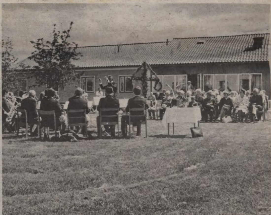
Flens blåsorkester spelade före och under friluftsgudstjänsten vid Solgården på midsommarafton. Det var första gången arrangemanget var förlagt dit och många hörsammade inbjudan.