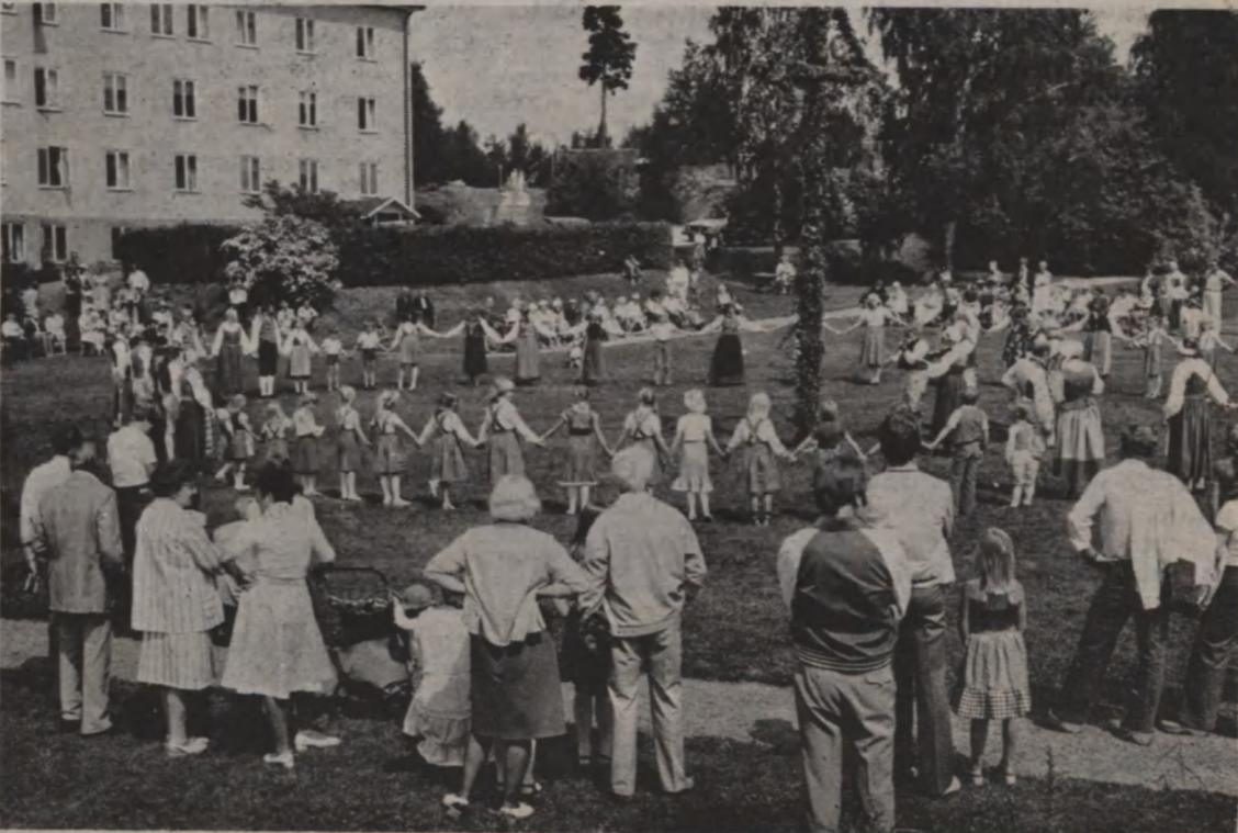
Det inledande midsommarfirandet vid ålderdomshemmet Björntorp lockade ett par hundra människor och sammanlagt gladda Oxelö Gille närmare 2 000 med sitt program.

sig i helgen l här. h av- ilbud r kla- har i n nton- r ut- olste- terna 4 000 från 1 000 nader r och n att bidra öm n r kört Innan Conny cklige r den priser Blom- e gick Gun ngvist, ingvar KUS stek EET -20 EN ingen sträff på Oxelösund kl 19.00 areta Sö- och folk- g. s välkom- eller till ning