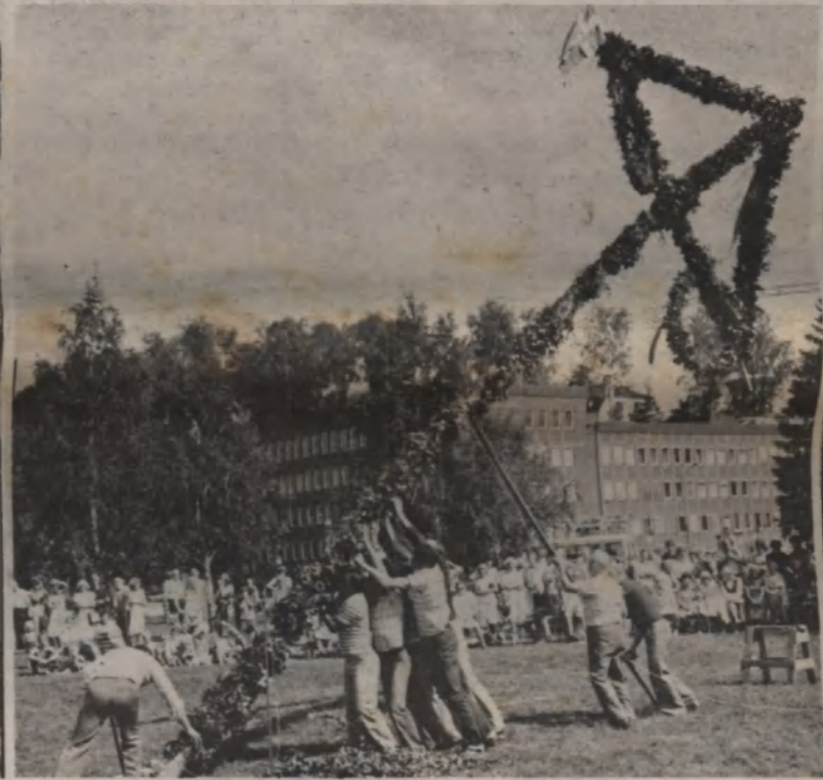
Starka armar reser majstången.