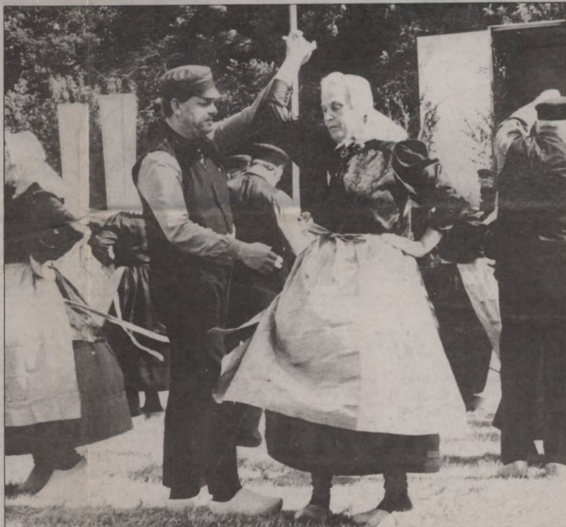
Speciellt inbjudna gäster var ett folkdanslag från Holland. De uppförde danser från sin egen trakt.

Det är polskor och marscher, fioler och durspel, unga och gamla. En och annan liten lycklig knatte får till och med själv pröva nyckelharpan, så återväxten är garanterad.