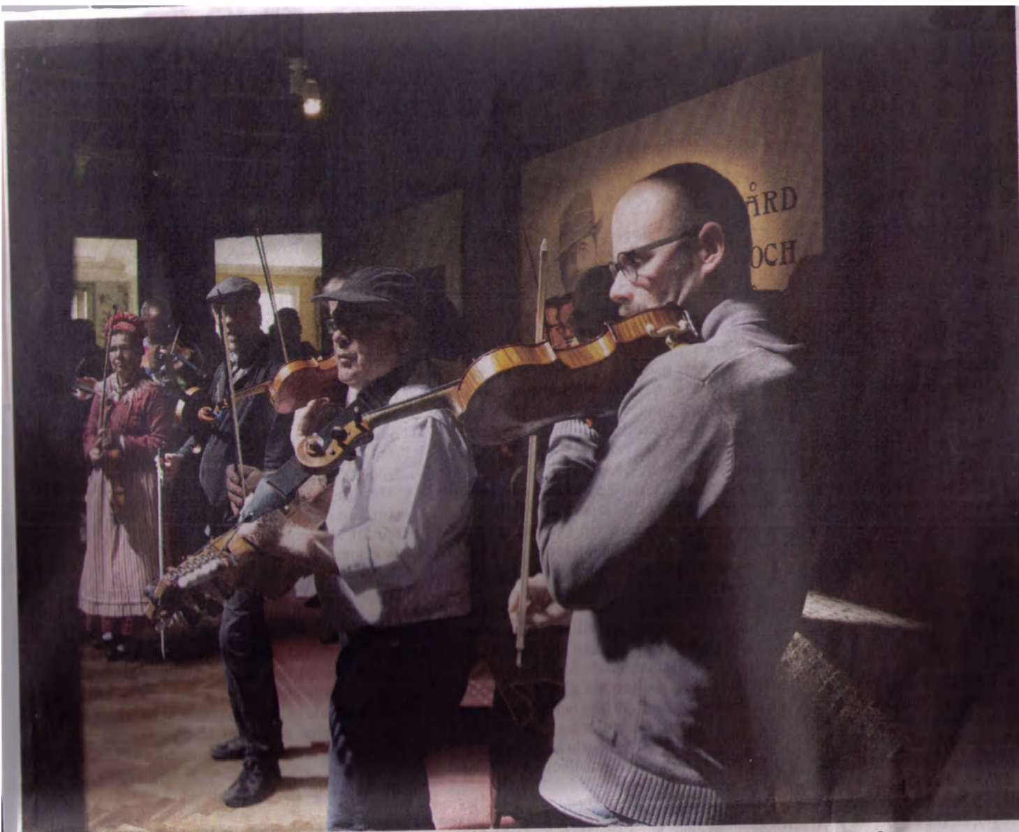
Nästan hälften av publiken reser sig upp, tar sitt instrument och går fram till scenen när det är dags för allspel.