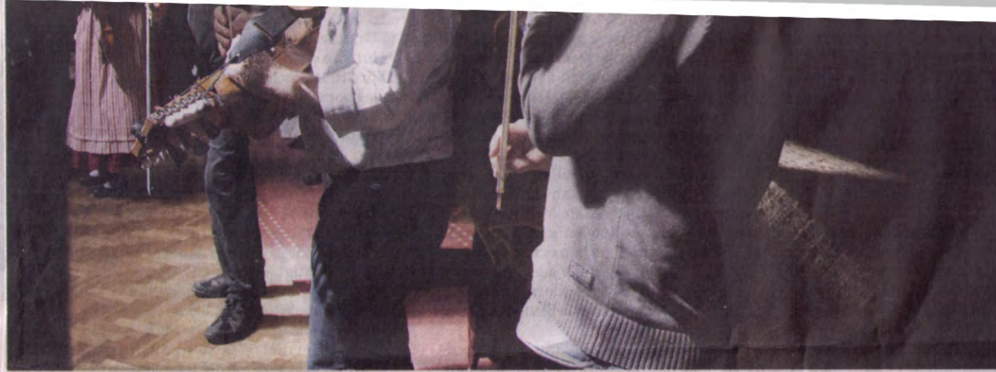
Nästan hälften av publiken reser sig upp, tar sitt instrument och går fram till scenen när det är dags för allspel.