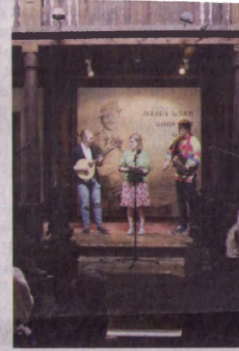
Bröllopsvals och polska spelades.