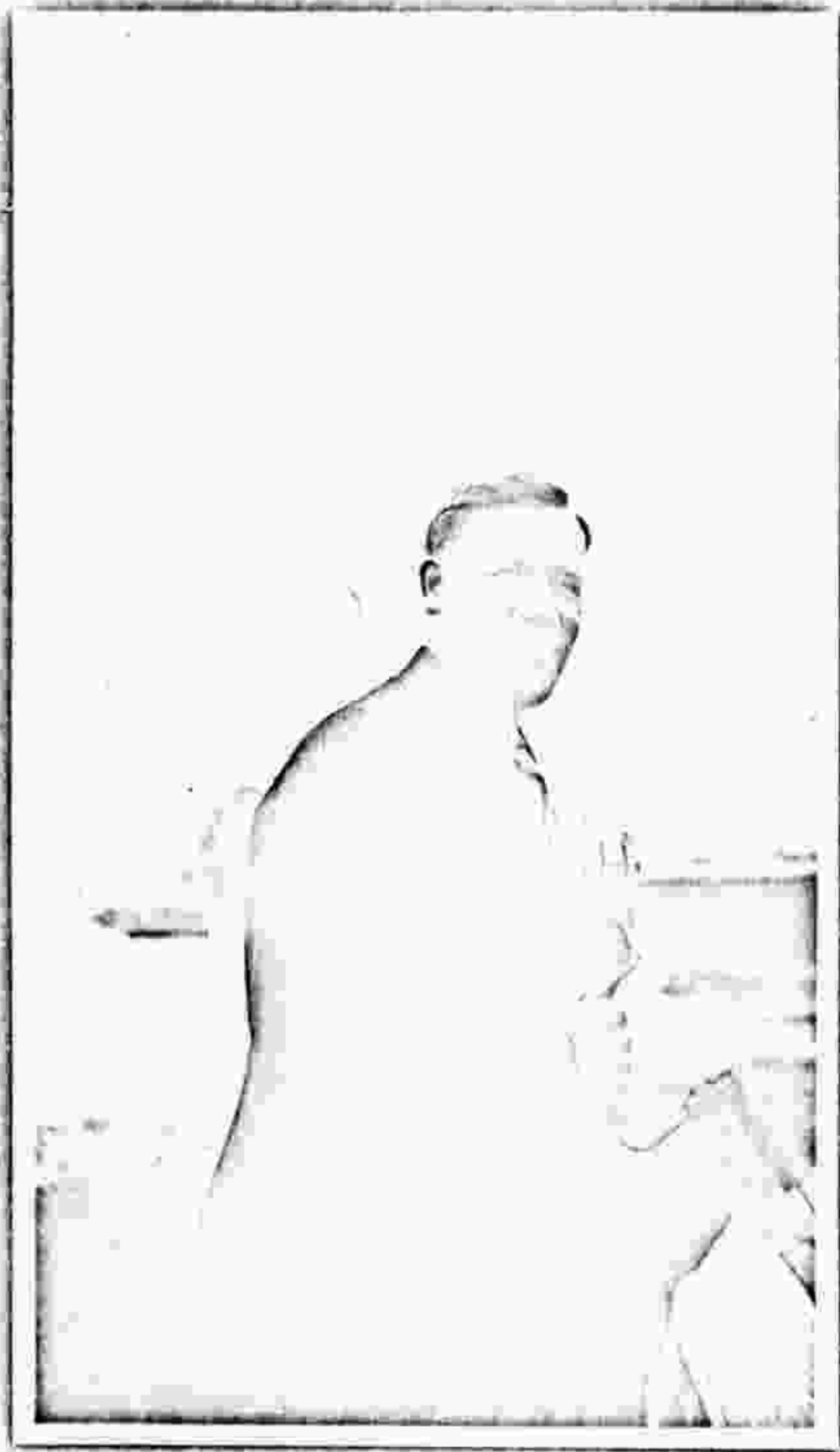
Handwritten text, likely a name and date, but it is very faint and illegible.