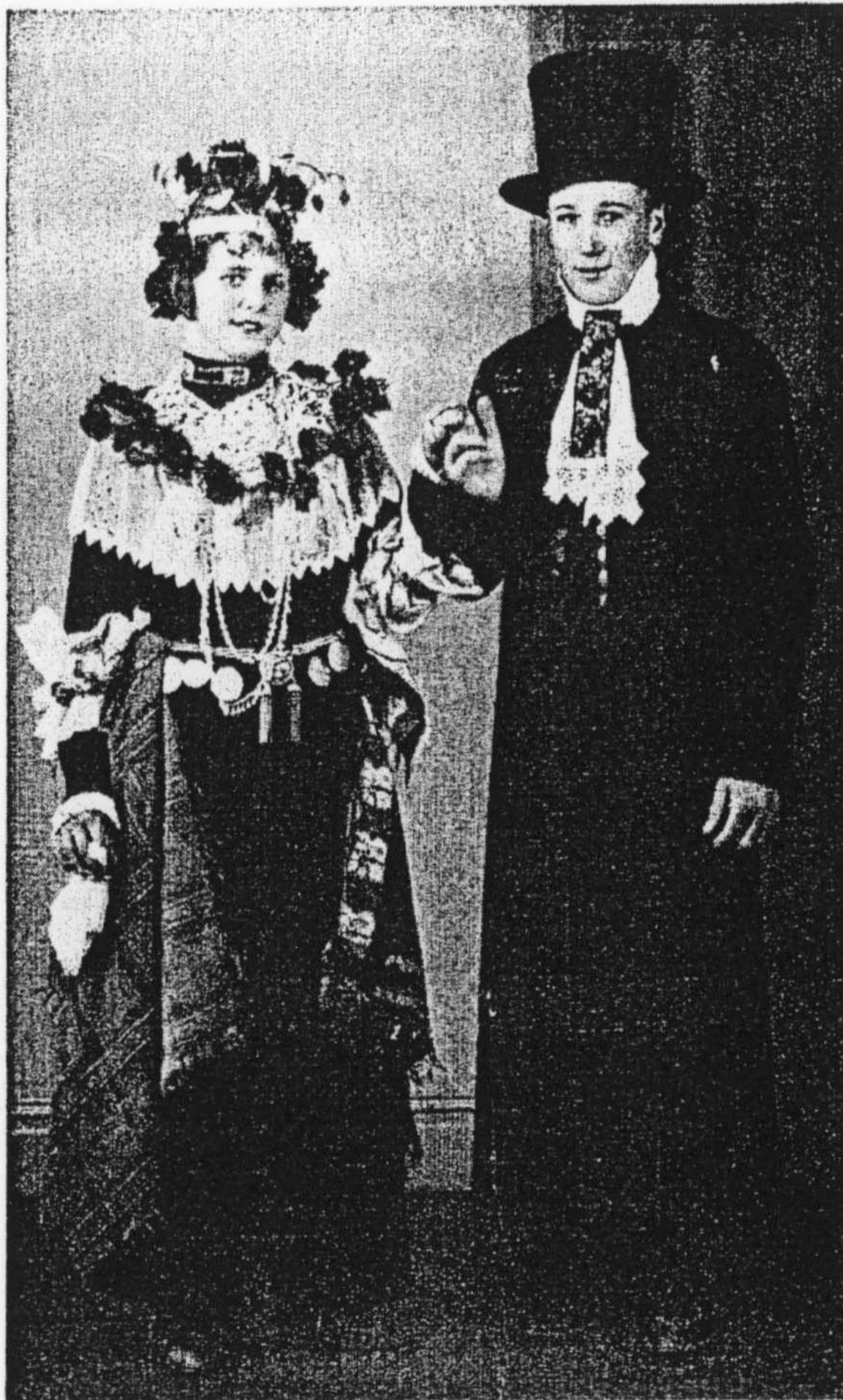
BRUDPAR FRÅN HÄLSINGLAND