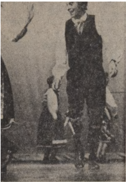
sade det estniska Rago-laget vid lör- rtalje Estrad.