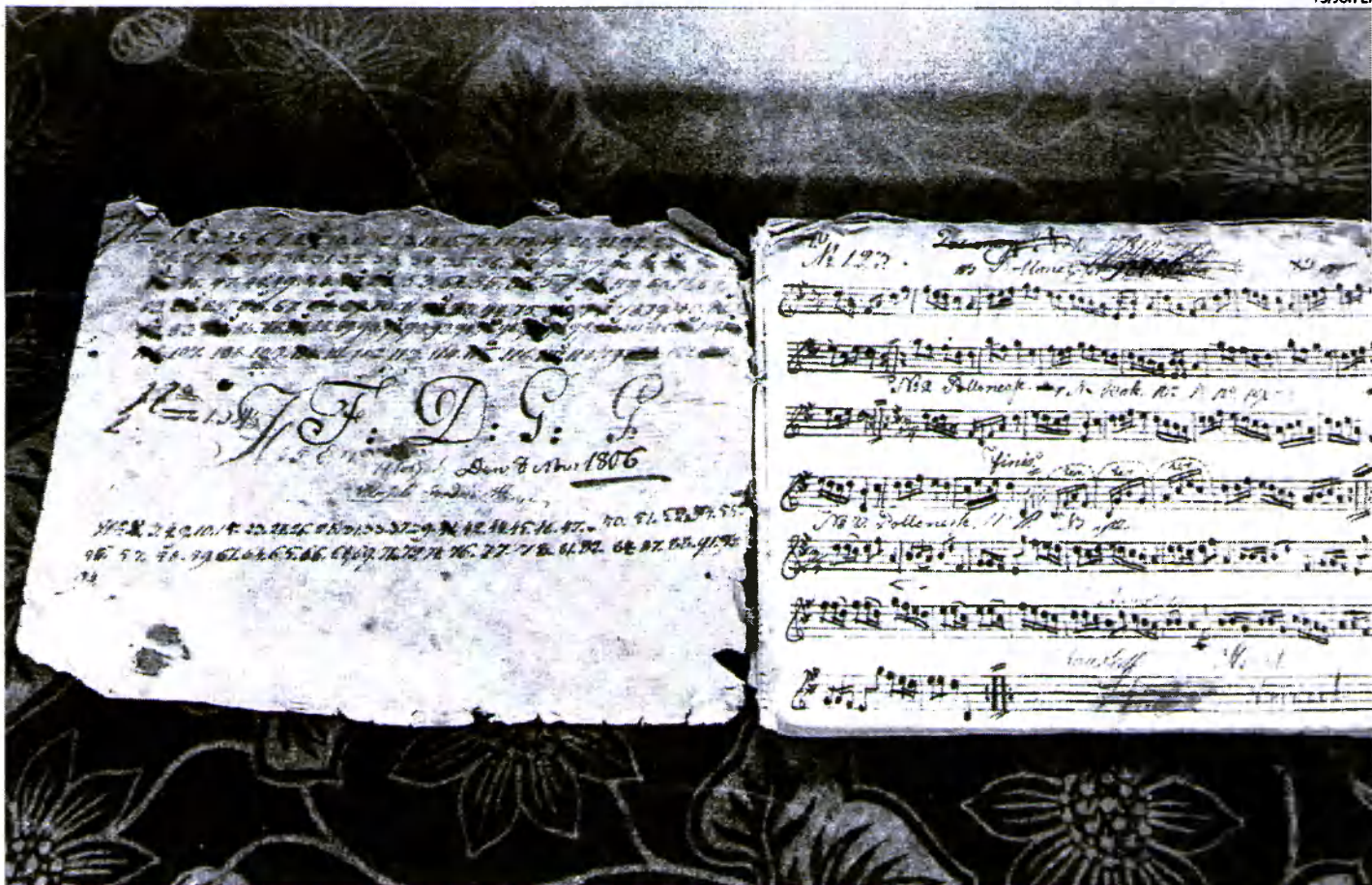
Vuodelle 1806 kirjattu A.F. Staren nuottikirja kuuluu Sibelius-museon kokoelmiin.