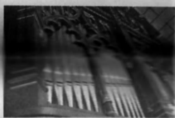
Bröllopsmarscherna är inspelade på kyrkorgel i sex sörmländska kyrkor.

– Det är härligt med orgelmusik och ibland har jag känt för att fråga maken om vi inte ska gifta om oss. Jag kan tänka mig svara ja igen till tonerna av en sörmländsk bröllopsmarsch ur domkyrkans pampiga pipor.